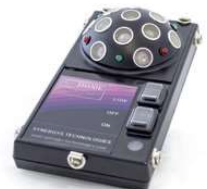
多向超音波發射器 Ref. LKSDOME