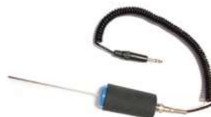
接觸式超音波感測棒 Ref. LKSPROBE