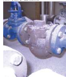
電弧局部放電檢測