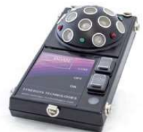
多向超音波發射器 Ref. LKSDOME