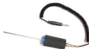
接觸式超音波感測棒 Ref. LKSPROBE